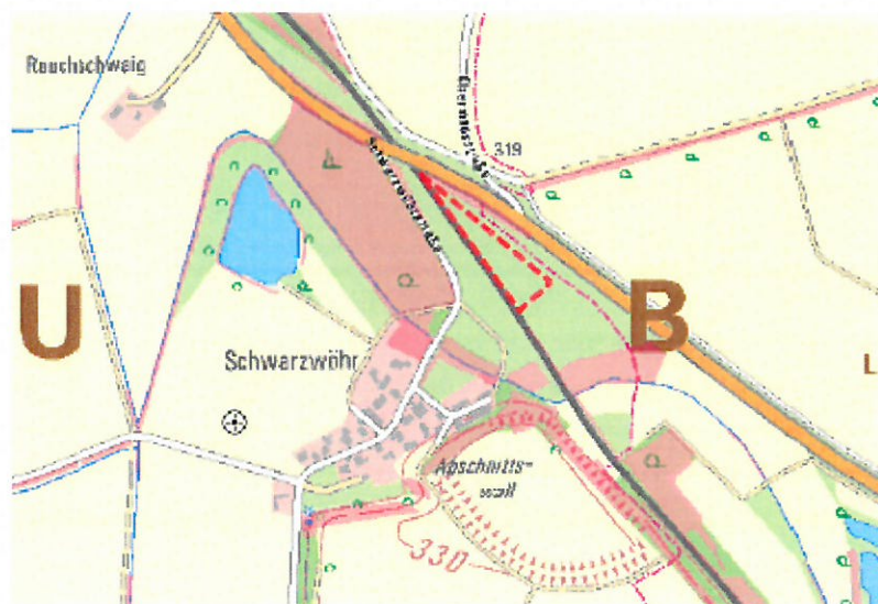
Übersichtskarte (nicht maßstäblich, BayernAtlas 2018)

Die Änderung erstreckt sich auf folgende Flurnummer 891, Gemarkung Aholming.