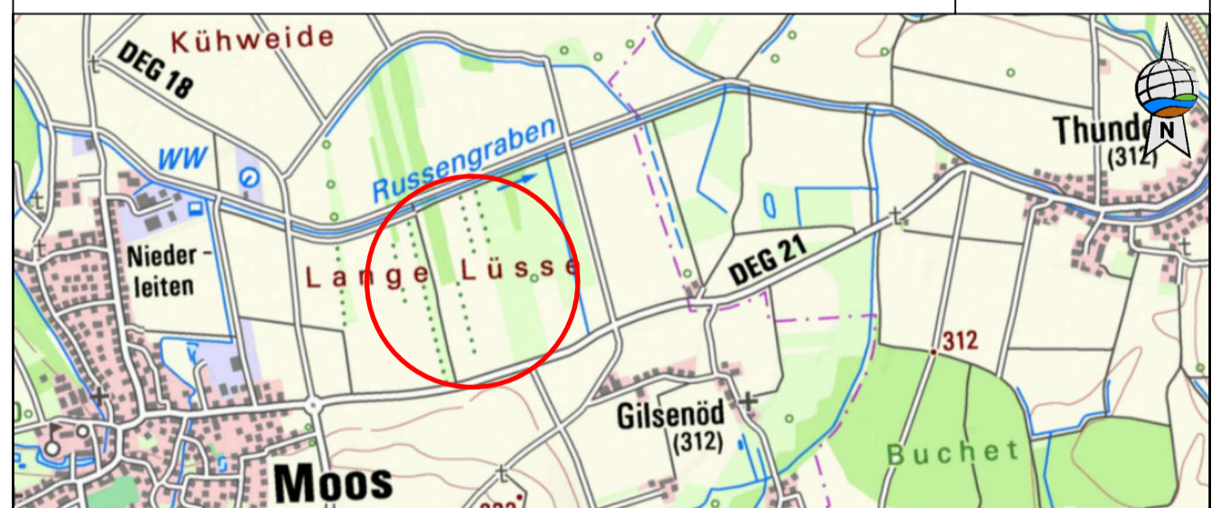
Übersichtsplan 1 : 25.000

Gemeinde: Aholming Landkreis: Deggendorf Regierungsbezirk: Niederbayern